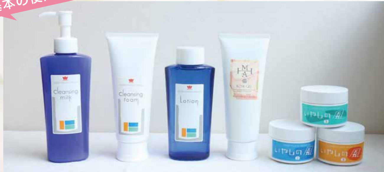
クレンジングミルク → 洗顔フォーム → 化粧水 → ローズジェル → いやしの風